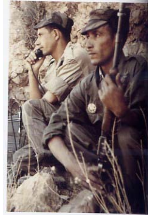
Dans les monts des Ksour, Commando de chasse n° 133 Goffin. Pl. Coll. general François Meyer

صورة 4 كوموندوس غريفون يمشطون نواحي البيض "جيري فيل سابقا"