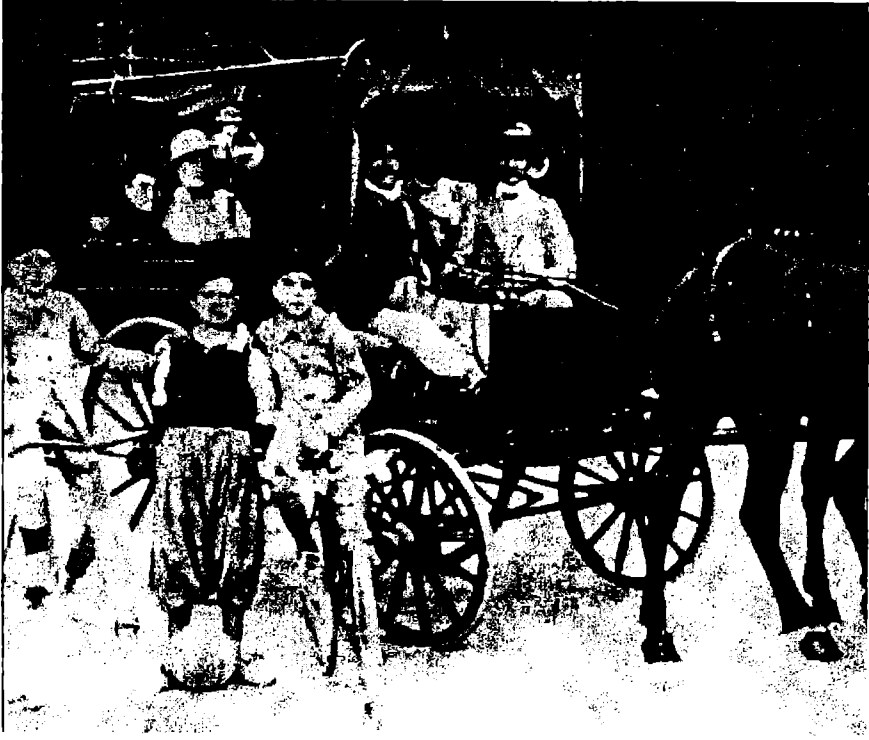
مصالي الحاج سنة 1908 و في عمره 11 سنة (في الوسط والكرة عند قدميه)