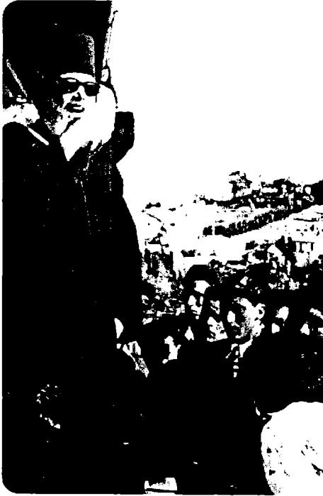
مصالي الحاج في فيفري 1952، يتوجه بخطاب لمناضلي العاصمة الذين جاؤوا لتحيته بعد عودته من البقاع المقدسة.