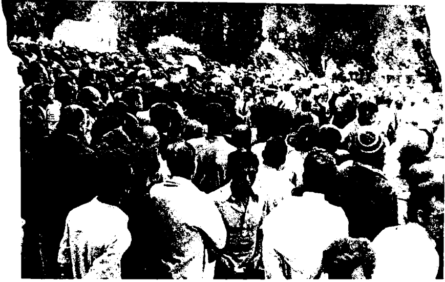
تشيع جنازة مصالي الحاج في تلمسان يوم 7 جوان 1974.