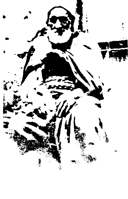
أحمد مصالي، أب مصالي الحاج (توفي وعمره 112 سنة)