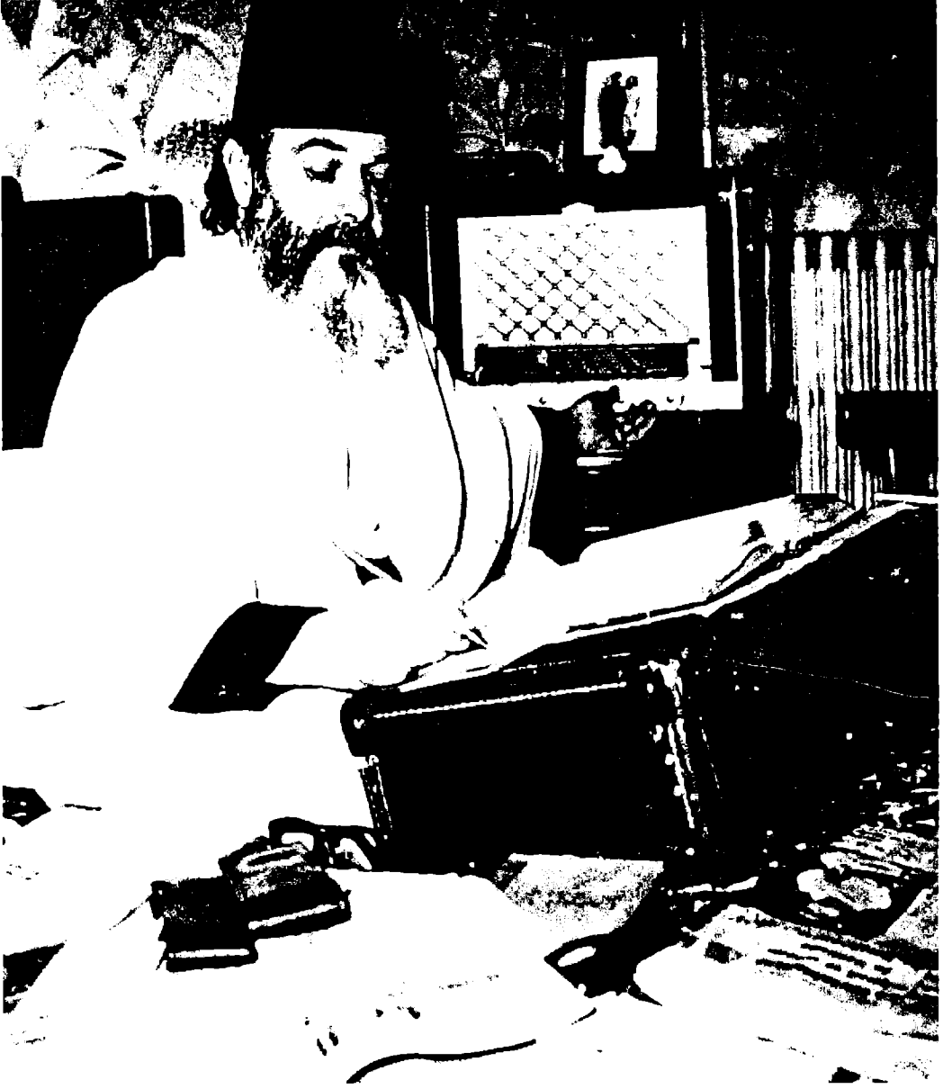
مصالي الحاج في فترة عمل في نزل نيورت أثناء الأزمة الحادة لحزب البيان من أجل انتصار الحريات الديمقراطية في أواخر 1953.