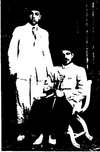
مصالي الحاج (جالسا) مع أحد أقاربه في زمن خدمته العسكرية.