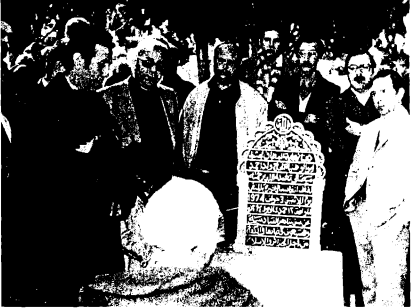
أحمد بن بلة بعد إطلاق سراحه، في وقفة ترحم على قبر مصالي الحاج، في نوفمبر 1980. ومباشرة على يساره يوجد مراد حميدو، الذي ناضلت عائلته في الحركة الوطنية.